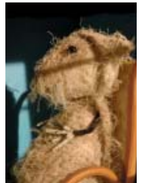
Hr. Muffin skal til USA.

Således er Teater Refleksion med til at udbygge den internationale anerkendelse, der i disse år bliver dansk børneteater til del.