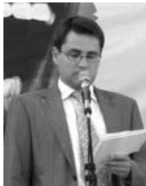
Kulturminister Brian Mikkelsen (K) vil have styr på statens tilskud til de små teatre.

Repertoiret betyder meget – men ikke i sammenhæng med prioriteringen af overhovedet at have et lokalt teater